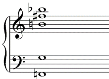
Exemplo 1: Acorde de Son et Lumière (MENDES, 2008, p. 291)

A composição apresenta uma estrutura cíclica com a constante alternância entre duas situações distintas: A) a manequim desfilando e se esquivando dos fotógrafos e B) a imobilização total dos intérpretes após a reprodução de um acorde gravado, seguido do disparo de flashes das câmeras fotográficas contra o público. Temos, portanto, a seguinte organização formal: Introdução – A – B – A – B – A – B – A – B' – A' (coda).