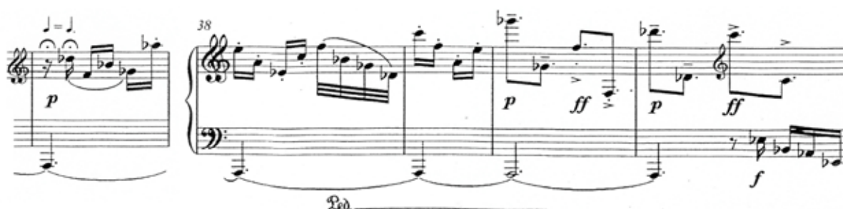
Figura 4 - (c. 37-41)

Referente às características idiomáticas empregadas pela compositora na peça Contrastes (2001), depara-se (Fig.4, c.37-41) com necessárias escolhas alusivas aos toques pianísticos que poderão ser aplicados para evidenciar a sonoridade demandada, no trecho, pela compositora.