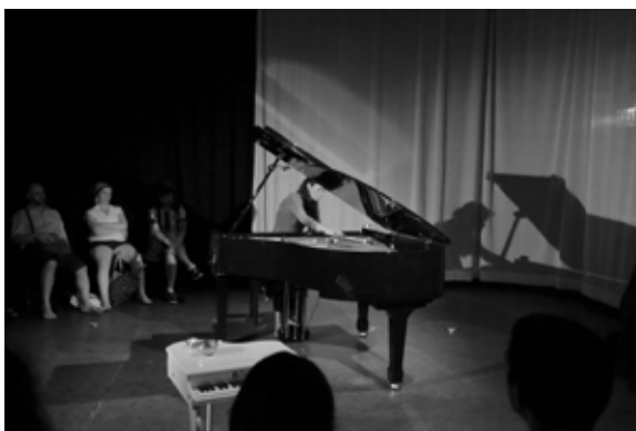
Fig. 2. myths & visions -efeitos de sombras no momento da peça “ Miragem ”.

Uma vez posicionada em frente ao teclado para a performance da peça, um foco de luz frontal foi acionado, a fim de projetar as sombras do piano e da minha imagem como pianista, na parede ao fundo do palco. Desta forma, o material da peça musical em si serviu também para gerar o conceito visual e o gestual coreográfico da performance, em diálogo com a interpretação musical.