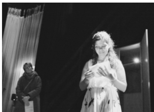
Fig. 1. casa - ação teatral da cena “Ecos”.

Assim, de uma forma simbólica e reflexiva, foi traçado um diálogo entre o texto literário, o conteúdo autobiográfico, e o material musical.