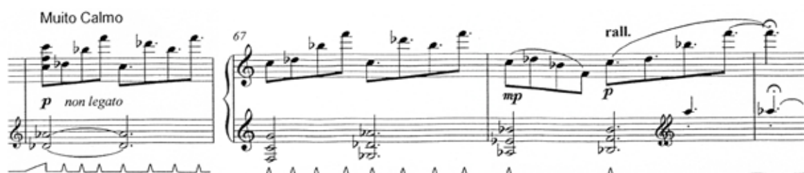
Figura 3 - (c. 66-69)

Rezende optou por escrever detalhadamente a utilização do pedal, a fim de tentar ser o mais explícita possível sobre seu ideário sonoro e angariar ou suprimir efeitos específicos de ressonância. Tal aspecto é desvelado na Figura 3, c.66-69.